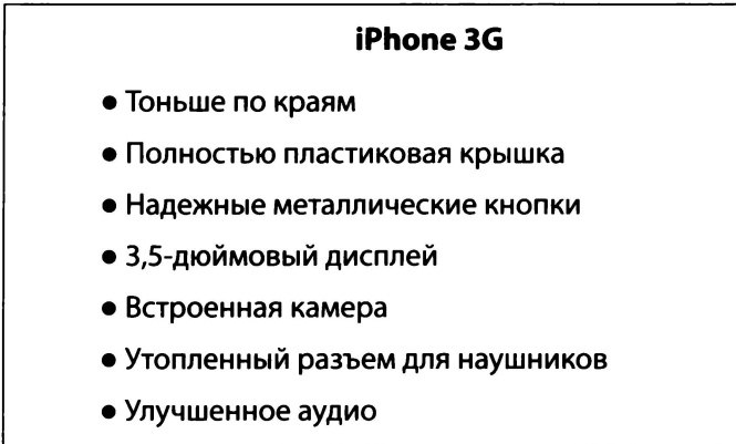
Рис. 8.2. Занудные слайды заполнены словами и не имеют графики

Когда Стив Джобс представлял MacBook Air в качестве «самого тонкого в мире ноутбука», один из слайдов представлял собой фотографию компьютера, стоявшего на конверте, который был толще компьютера. Вот так просто. Никаких слов, никаких текстовых врезок, никаких графиков — просто фотография. Насколько более мощными могут стать ваши выступления? Чтобы представить, какие слайды обычно делают посредственные выступающие для описания технического продукта, посмотрите на рис. 8.3 . Верьте или нет, но этот пародийный слайд выглядит просто лебедем среди сотен гадких утят, которых мне пришлось увидеть на презентациях! Это смесь шрифтов, стилей и текста.