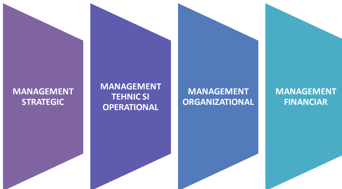
Figura 2: Direcții de dezvoltare și îmbunătățire a I.M.

Pentru îmbunătățirea activității serviciului de salubritate, eforturile operatorului și ale APL ar trebui să fie concentrate către îmbunătățirea și modernizarea activității curente în cadrul principalelor sectoare de activitate ale I.M și orientate către atingerea obiectivelor prezentate în cadrul tabelului 1.