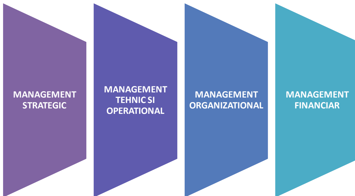
Figura 2: Direcții de dezvoltare și îmbunătățire a I.M.

Pentru îmbunătățirea activității serviciului de salubritate, eforturile operatorului și ale APL ar trebui să fie concentrate către îmbunătățirea și modernizarea activității curente în cadrul principalelor sectoare de activitate ale I.M și orientate către atingerea obiectivelor prezentate în cadrul tabelului 1.